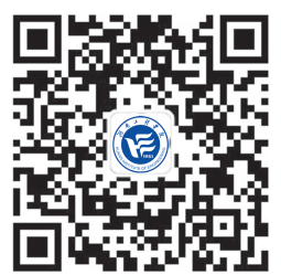
湖南工程學院 微信公众平台