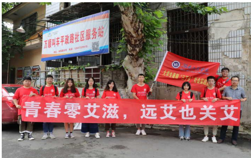
启动仪式全体合影

为加强精神文明建设，呼吁全民增强防范意识，提高公众对艾滋病的认知程度，号召更多人加入防艾的行列，7月10日上午，湖南工程学院电气信息学院暑期“三下乡”社会实践团前往湘潭市雨湖区平政路街道和雨湖公园，开展“青春零艾滋，远艾也关艾”主题活动。本次宣传活动以普及防艾知识、调研防艾状况的形式展开。