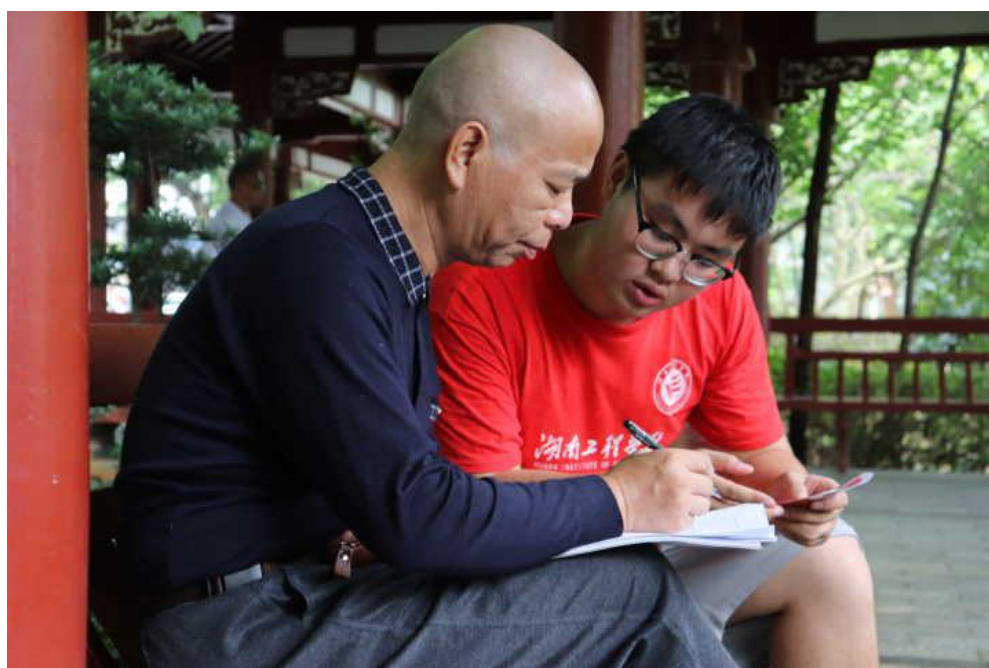
与居民进行问卷调查

另一部分团队成员开展了防艾现状调研。通过资料收集、问卷调查等方式，志愿者深入了解该街道防艾最新形势、存在的实际问题，分析并形成解决方案。调查显示，大部分受访者对艾滋病的了解较为充分，在传播途径方面，能准确答出艾滋病传播途径的超过半数，谈及如何对待被感染了艾滋病该怎么办时，几乎所有的人都表示会正常对待，不会歧视、孤立。