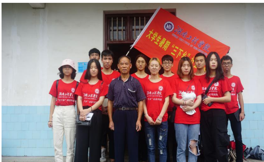
湖南工程学院实践团与贫困户合影

“贫困户的扶持，经济上的扶持只是一时的帮助，志气上的扶持才是一世的帮助。”通过实际入户调研以及和扶贫干部的交流，实践团深切认识到扶贫的关键在发展当地产业，助推当地经济发展，让更多的劳动力投身农村建设。因此，下一阶段，实践团将调研当地产业，更好地为精准扶贫贡献力量。