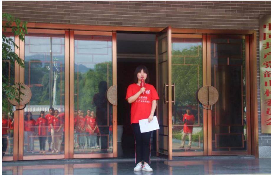
湖南工程学院应用技术学院“三下乡”活动启动仪式