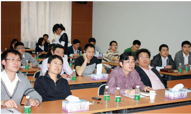
培训教室一同分享华辰宣传片