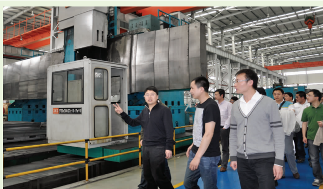
车间参观数控龙门刨铣床