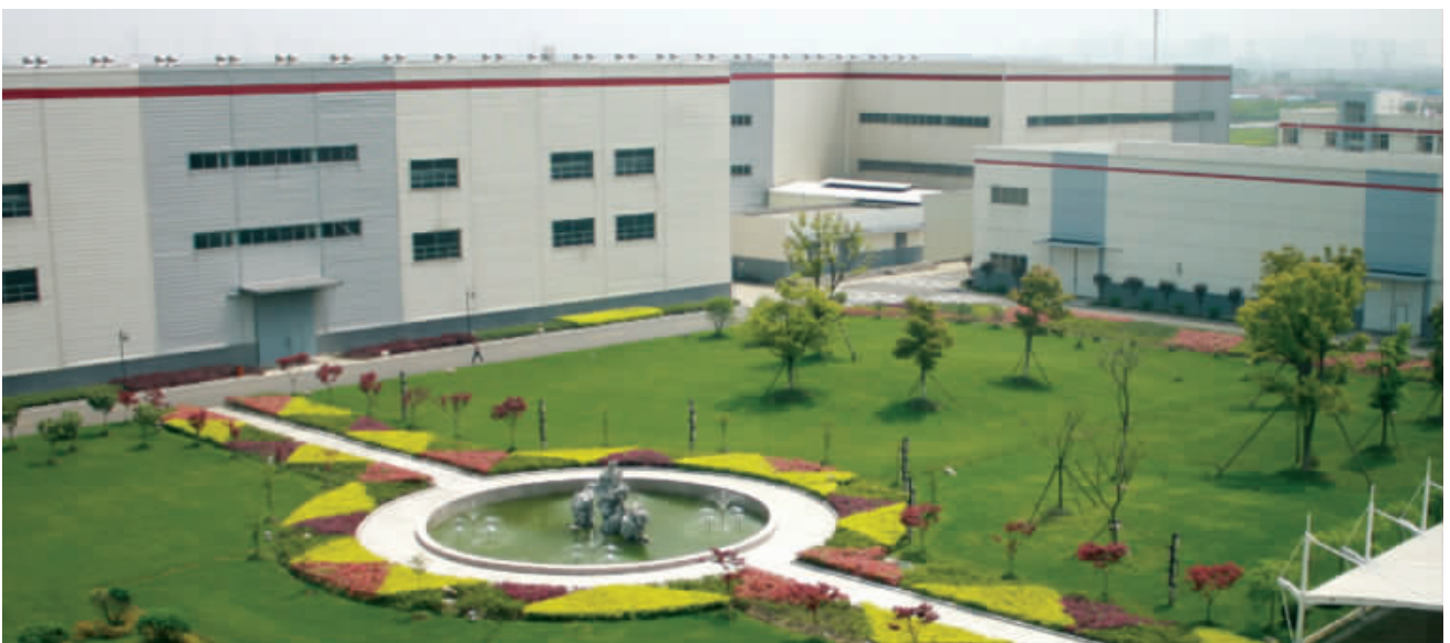
华辰重机三期工厂一隅