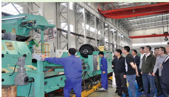
参观正在调试的华辰产品