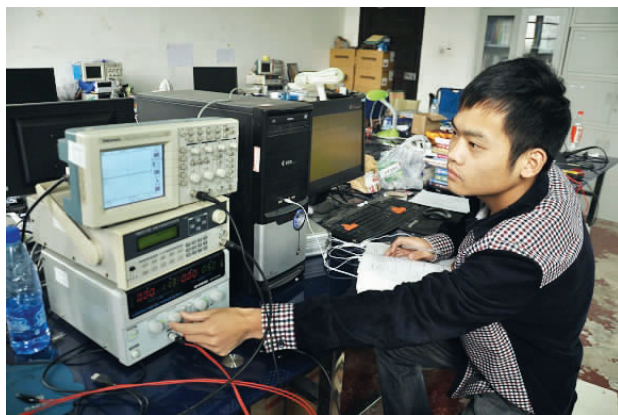
学生用的实验室设备很先进

然而展望前路，并不全是鲜花与光明的坦途。实验老师们谈到，目前实验室仍有规模较小、学生创新活动耗材费用高、参与的老师少。实验室正努力争取到更多渠道的支持，通过自身努力取得更好的成绩来争取学校更多重视等途径解决，并已取得显著效果。