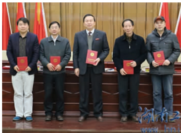
第十届湖南省高等教育省级教学成果奖二、三等奖获得者