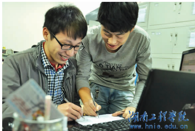
学生碰到问题经常相互请教