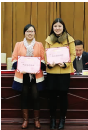
湖南省普通高校教师课堂教学竞赛一等奖获得者