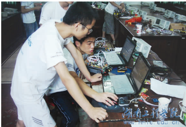
2011 年全国二等奖得主在调试程序

经历 20 年的发展，竞赛已经成为目前国内高等院校参与规模最大、认可度最高的学生竞赛活动之一，上届竞赛有来自全国的 1044 所院校，共计 11838 支队伍、35514 名学生参赛。根据教育部 2013 年统计数据显示，全国普通本科院校数量只有