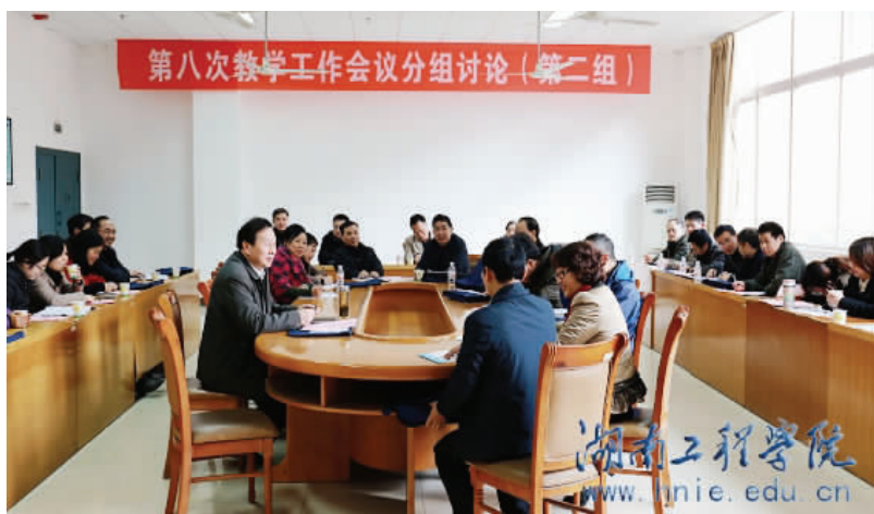
第八次教学工作会议分组讨论

报告提出,要大力加强师德师风建设,形成优良的教风学风,促进我校内涵发展。加强师德师风建设是教师职业本身的基本要求,也是促进学校内涵式发展的必然要求和前提条件。要完善规章制度、创新师德教育、加强考核监督、严格执行管理制度、