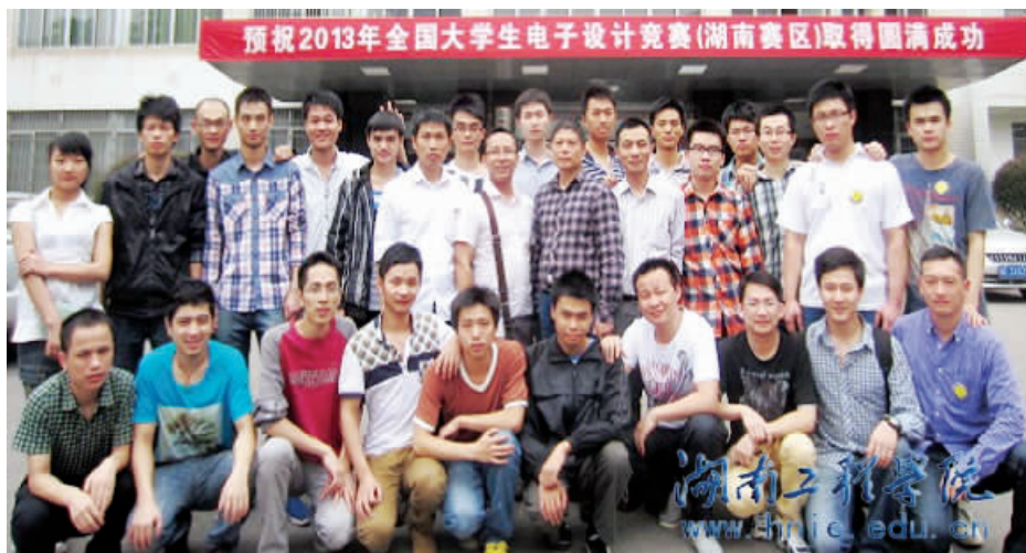
2014年全国电子设计竞赛师生合影

（电气信息学院 曾志刚 学 通社 赵开强 闫朝旭 唐 桔 摄影：邓 奕 黄 峰）