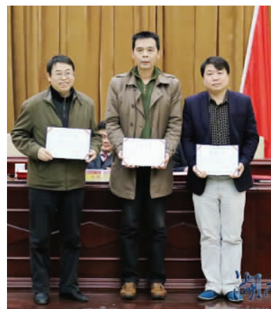
第三届湖南省教育科学研究优秀成果奖二、三等奖获得者