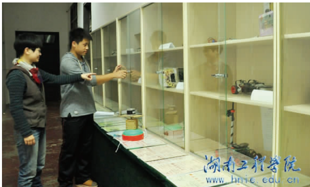
很多人的作品进了展柜

为了让基地学生的学习有的放矢，除了认真组织、鼓励学生积极参加各类官方或企业主办的学科竞赛外，还组织学生申报校级、省级、国家级的大学生研究性学习和创新性实验计划项目，以及大家所熟知的“德力西电气杯”，竞赛获奖学生将获得优先去德力西公司研发中心实习、工作的机会。老师们还鼓励学生参与到指导老师的科研项目中。项目成为了学生学习的一个强劲的驱动力，为了完成一个项目，学生经常“连续作战”不觉得累。进入创新实验室接受教育的学生表示，来了之后动手能力更强了，自己的目标定得高了，当然有更广的就业前景，能更好适应创新型、科技型企业。李延平表示，学生参加创新活动百利无一害，对工科学生而言，实验室的学习能提高自身解决