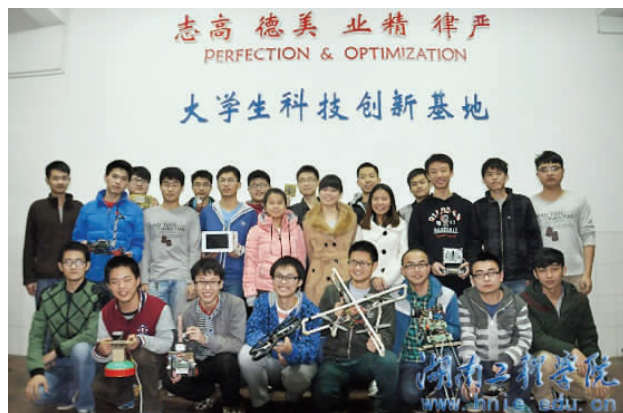
创新实验室“专员”大家庭

对实验室的发展，李延平信心十足地表示，实验室承载着竞赛训练和日常培训。老师们除了培养学生做事，还培养学生做人；透过由点及面的辐射，通过学生带动班级、发挥良好学风的感染作用，在专业里实现均衡培养，从而在更大层面上提升学生综合能力。