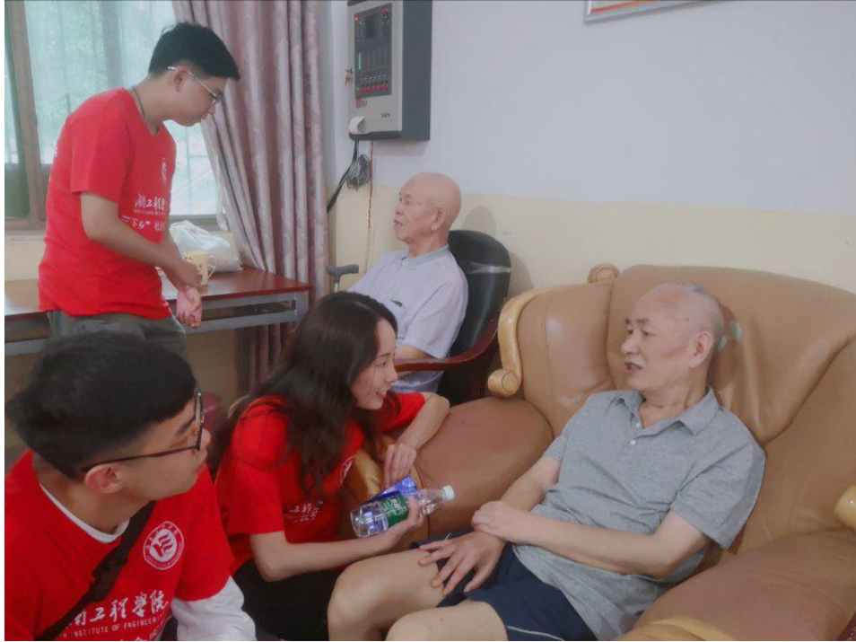
教育关爱服务团成员与老人进行交谈

活动结束后，教育关爱服务团成员与老人拍照留念，欢快融洽的时光虽然短暂，但每个服务团成员和老人的脸上都一直都洋溢着笑容。