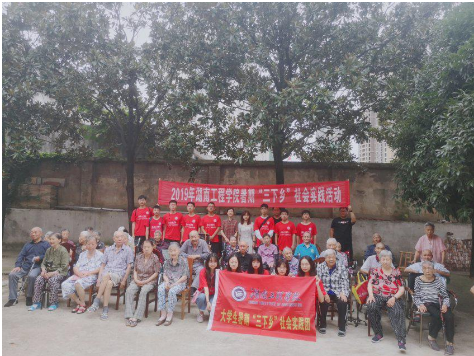
教育关爱服务团成员与老人留影纪念

活动结束后，教育关爱服务团成员与老人拍照留念，欢快融洽的时光虽然短暂，但每个服务团成员和老人的脸上都一直都洋溢着笑容。