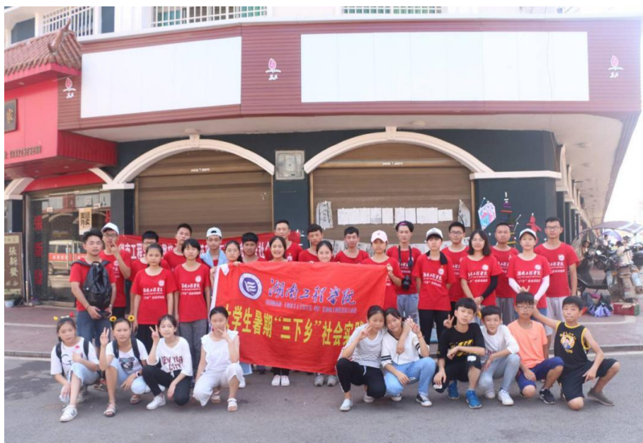
支教团队与花石中学的孩子们合影