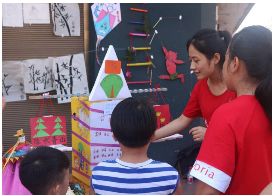
支教小老师向围观的孩子们讲述社会主义核心价值观

据悉，这些作品或是在花石中学学生们在团队成员的指导下完成，或是团队成员们与学生们一起动手共同完成的。作品形态各异，各有千秋，创意十足。路人们被新颖的作品所吸引，纷纷停下脚步前来观看。简笔画作品构思巧妙，选题为同学们都熟悉的荷花。一朵朵荷花被同学们绘画得格外逼真，有的荷花含苞待放，有的则盛开花瓣，栩栩如生。国画作品着墨新颖，每幅水墨竹子融入了同学们的想法，显得各有特色和风格。有的笔直挺拔，有的则竹叶繁茂，体现了竹子独特的魅力。