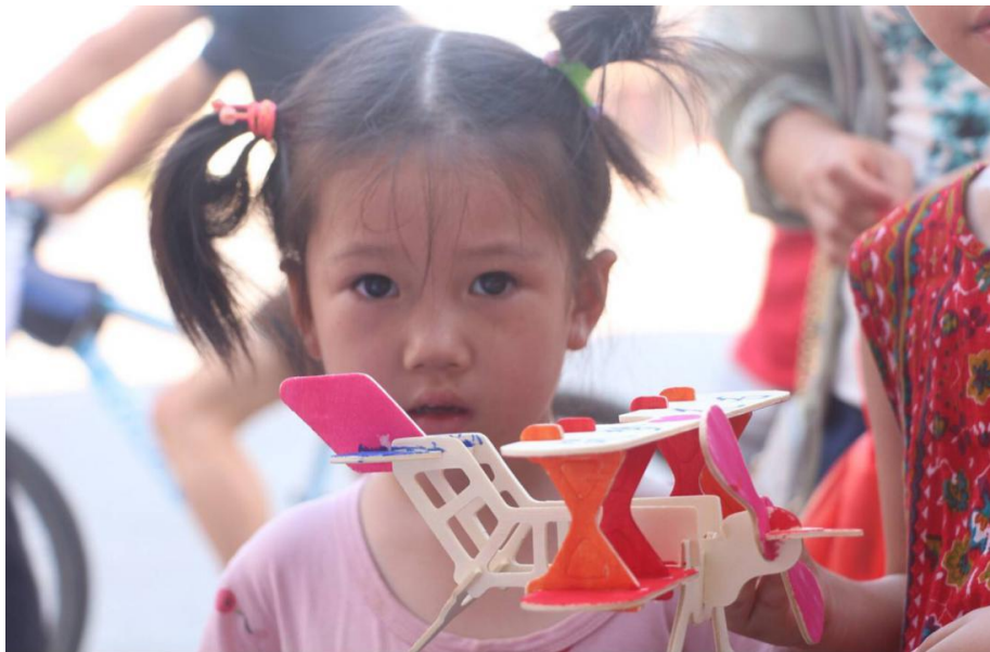
围观的小孩子注视着镜头

精美的手工创意品使过往的路人连声赞叹，驻足观赏。“大家看到的手工创意品的材料大多取自废弃物品，是我们和花石中学的同学们一起完成的。”志愿者在旁讲解道。手工作品吸引了众多小朋友和家长前来观看。小朋友询问作品制作材料和过程，志愿者们耐心的为其解答，鼓励他们在今后也可以利用废弃环保材料做些手工制品。用废弃筷子制作的相框在同学们的精心装饰下既美观又有使用价值。用纸箱板制作的孙悟空皮影惟妙惟肖，用树叶拼凑的人物也很有极具创造力。最后，在展览收尾前，学生们为观众们深情朗诵了一段精彩的《少年中国说》。