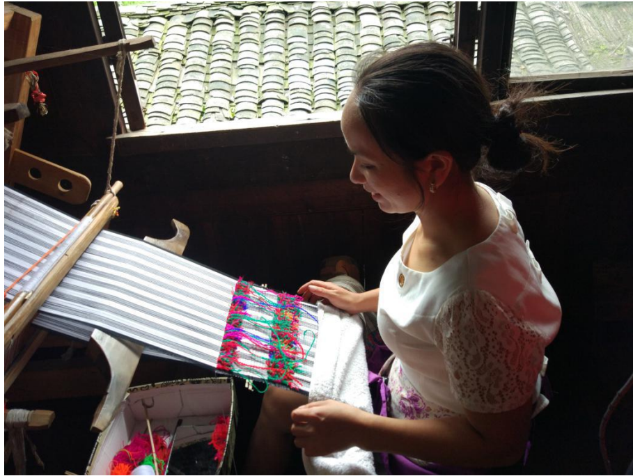
成员们观看苗寨阿妹纺织头巾

“这里四线，然后一线，然后再四线。”婆婆这样叮嘱媳妇，“错上一步，步步都错了。”她向实践团成员们这样解释道。她正在制作苗族特有的头巾，头巾由最基础的黑白两线密密竖着排列成相互的两面，在此同时，用五彩的线横着穿插在其中形成头巾上美丽的花纹，横纵交贯，编织经纬，两面成一面，从而形成一条精美的头巾。 “听上去似乎很简单，但事实上要比此麻烦的多。”老婆婆这样说到。勾花的时候，密密麻麻的黑白二线，极其耗费眼力，还要用特制的木梳子把线梳直，否则线会打结，但不能太用力否则梳子会断掉，再用金属块插在交互的两面中，用力砸向刚刚勾好的花纹。“这样才会紧一点，头巾才不会散掉。”老婆婆这样向实践团成员们解释。当被询问到是否会把头巾拿出去卖的时候，她摇了摇头说：“不会拿出去卖。做完一条头巾最少要一个星期，如果真正卖的话起码要几百块，但是别人不会买因为太贵了觉得不值，但是对于我们来说却是十分珍贵