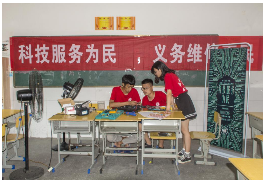
与时间赛跑，志愿者连夜修复电磁炉