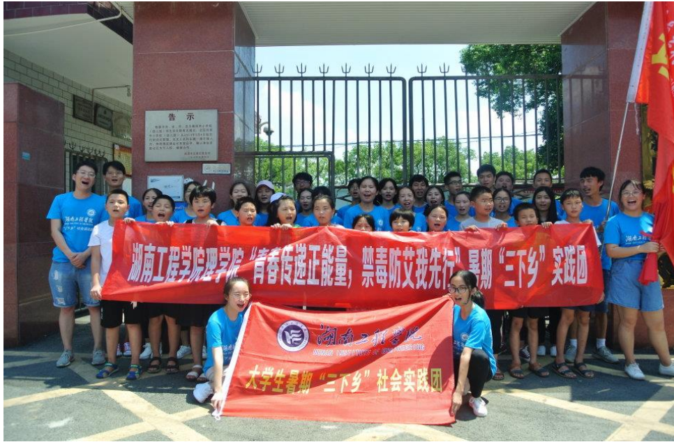
实践团与学生合影