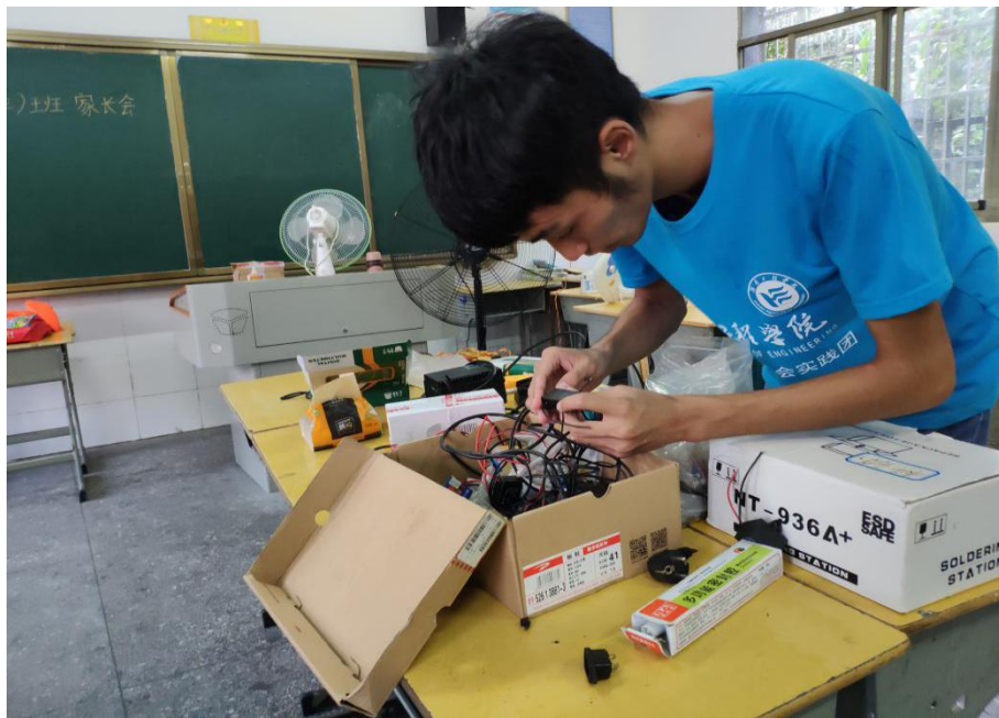
志愿者在准备维修用具

科技服务入乡村，义务维修系民情。湖南工程学院电气信息学院暑期社会实践团在怀化市溆浦县思蒙镇中心小学开展电器义务维修活动，旨在发挥专业优势与特长，为老百姓谋福利。