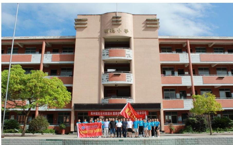
“三下乡”志愿团与当地领导和老师合影

启动仪式于上午 10 点正式结束。建筑工程学院“三下乡”教育关爱服务团是优秀且充满活力具有时代精神的一支队伍，自重自律，自奋自强，顺应时代，用行动来践行党的十九大相关精神，用教育关怀、人文调研、传播文艺等多项工作在社会上传播，使更多的人来关注农村，关注教育，关注基层。