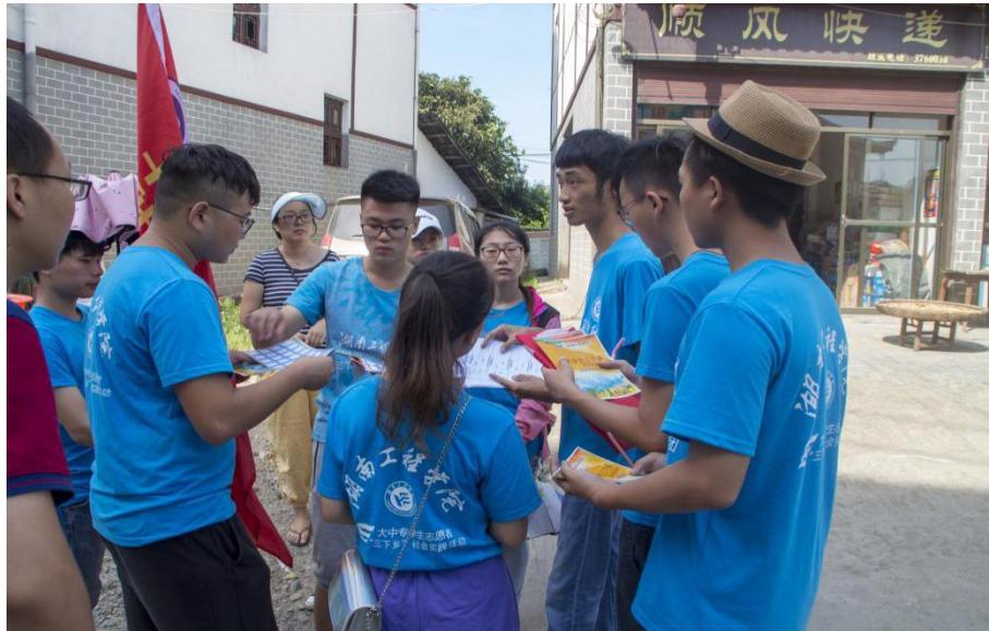
志愿者在分配宣传任务

“爷爷，您好！我们是湖南工程学院电气信息学院的学生，现在我们在进行暑期社会实践活动，您家里有什么坏掉的家电吗？我们在思蒙镇中心小学有电器义务维修活动，您可以拿来给我们修，不要钱的。”从最初的怀疑，到最后的热情邀请，志愿者们得到了村民的认可。