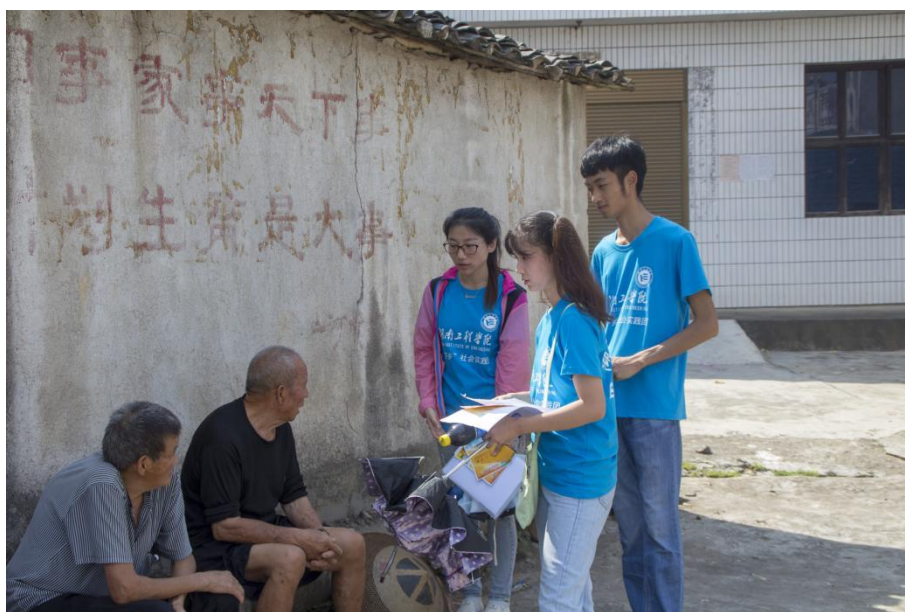
志愿者向村民宣传电器义务维修活动

“爷爷，您好！我们是湖南工程学院电气信息学院的学生，现在我们在进行暑期社会实践活动，您家里有什么坏掉的家电吗？我们在思蒙镇中心小学有电器义务维修活动，您可以拿来给我们修，不要钱的。”从最初的怀疑，到最后的热情邀请，志愿者们得到了村民的认可。