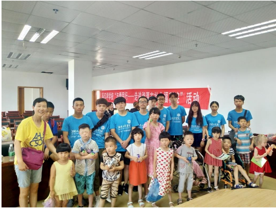
教育关爱服务团与福利院小朋友们合影

每一个孩子都是在人间的小天使，福利院的孩子们与别的儿童一样，是天使，虽然他们曾被折断过翅膀，可是他们也应当得到有温度有暖意的时光。他们不是人们想像中那种封闭的古怪的孩子，他们也充满着阳光与朝气。正如福利院院长所说，福利院的孩子们要在快乐的环境下健康茁壮的成长，需要志愿者们多多参与进来。在社会这个大家庭中，每一个人都有责任和义务去呵护他们，正如一句歌词“只要人人都献出一点爱，世界将变成美好的人间”。