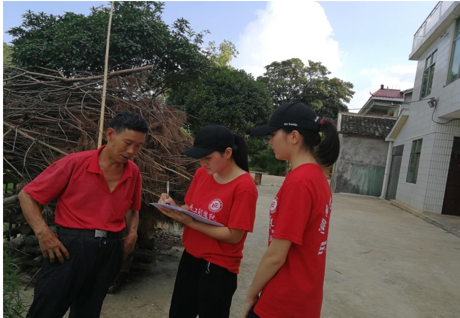
志愿者与村民共同填写调查问卷

大学生暑期“三下乡”社会实践是高校素质教育的有效载体,也是大学生锻炼自身综合素质、提高实践能力、更是展示当代大学生风采的最好平台。管理学院“三下乡”实践团成员们希望通过此次调研活动,能够深入了解农村宅基地使用现状以及空置房宅基地和住宅原因,利用自身专业知识,探讨农村宅基地退出与补偿模式,针对国家相关政策,提出合理意见,在促进自身发展的同时,为社会发展做出贡献。