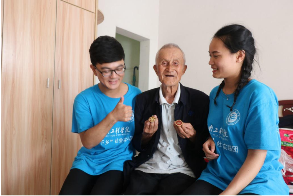
闪耀的勋章是用流血换来的