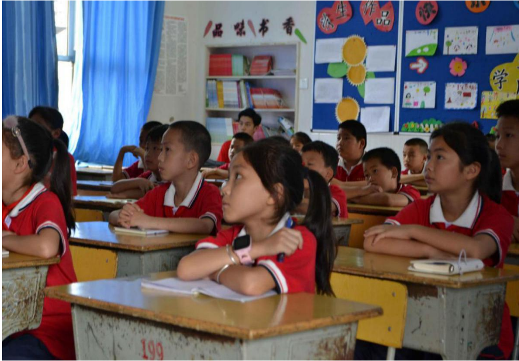
方家屯小学的学生正在认真上课