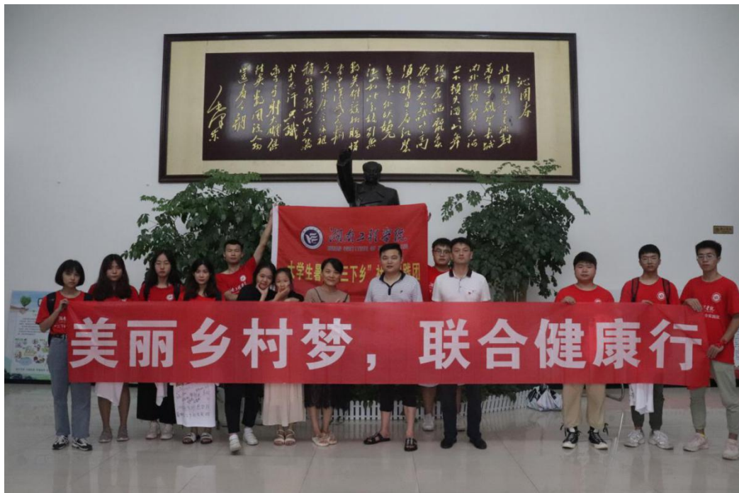
美丽乡村梦，联合健康行团队与联合村村委人员合照

志愿者和村民们共同表示，要坚持规划先行，因地制宜确定整治目标任务和建设时序，分类梯次推进。要突出工作重点，有序推进农村生活垃圾和污水处理，扎实开展农村“厕所革命”，加快提升村容村貌。