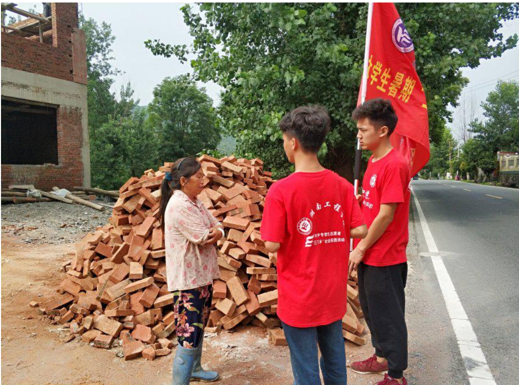
扶贫调研组正在与当地村民交流