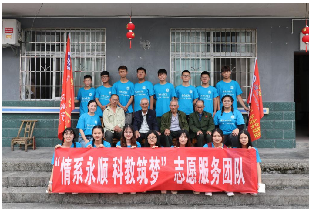
志愿者与爷爷们合影留念

我们都很珍惜这段时光，希望可以给他们带来快乐。我们希望以后常有机会来看看他们。他们身上有着很多精神值得我们来学习。爷爷们是我们心目中的英雄，值得我们永远敬仰，永远被人记住。他们的革命情怀深深地打动了我们。此次活动不仅增强了党员们的爱国情怀，还加深了大家对红色革命文化的认识。作为当代青年，我们要不忘初心，牢记使命，不断提高自身综合素质，为实现中华民族伟大复兴的中国梦贡献力量。