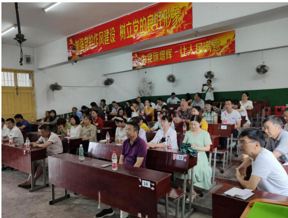
花石镇各中小学英语老师认真聆听讲座

人才兴则乡村兴，人才强则乡村强。推进乡村振兴，人才是关键。此次讲座的举办，旨在充分发挥自身学科优势积极响应人才振兴战略，造就更多乡土人才，将人才振兴战略落到实处。