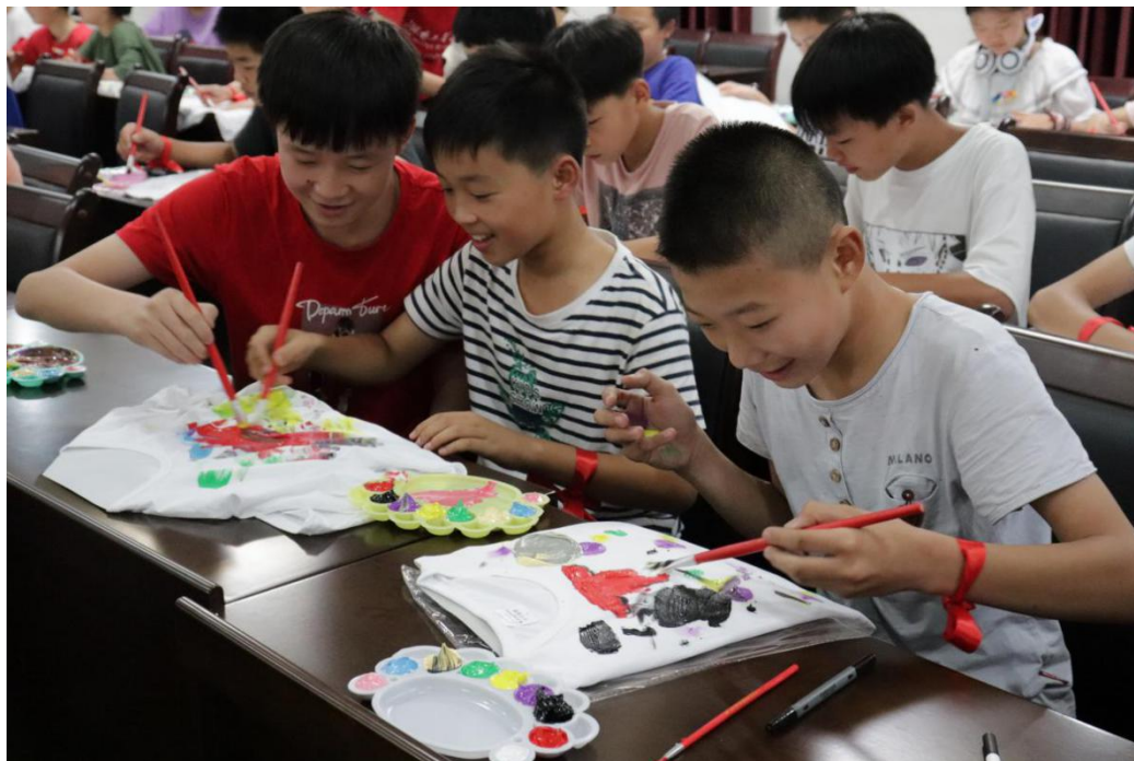
电气信息学院三下乡志愿者和小朋友们一块绘制文化衫

感受。底稿，构线，上色，每个步骤都有条不紊地进行着，缤纷艳丽的颜色在白色T恤上一笔笔铺展，志愿者和青少年以青春的名义，筑梦联合村，奋进新时代。