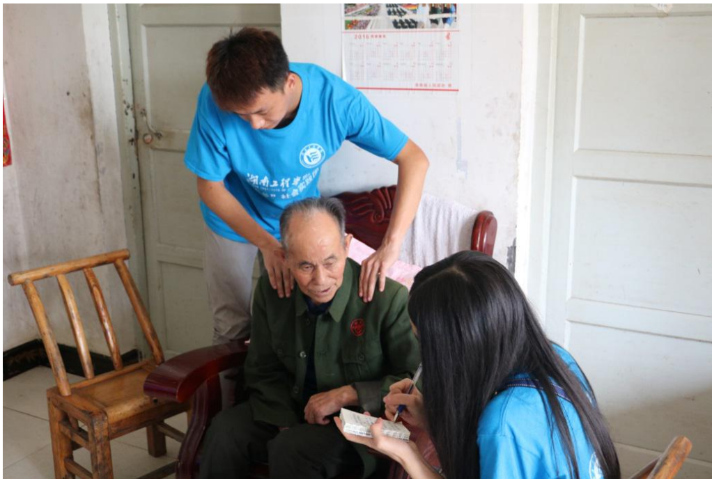
志愿者为彭爷爷按摩