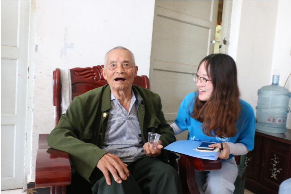
听完红军故事的志愿者与这位身经百战的老红军合影

觉得他是一名当之无愧的英雄。他英勇奋战，不怕苦，不怕累的精神深深地打动了我。这些精神值得我们世代传承。作为新时代的青年，我们应该学习老红军艰苦奋斗，不畏艰难的精神，在困境中锻炼自我、实现自我、升华自我。