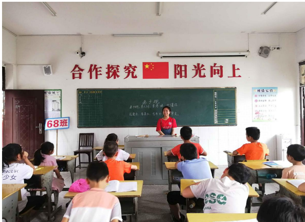
服务团支教组的老师正在上课

据悉，服务团将继续深入开展调研工作，为晃州镇的贫困户脱贫出谋划策，建设更好的新晃。