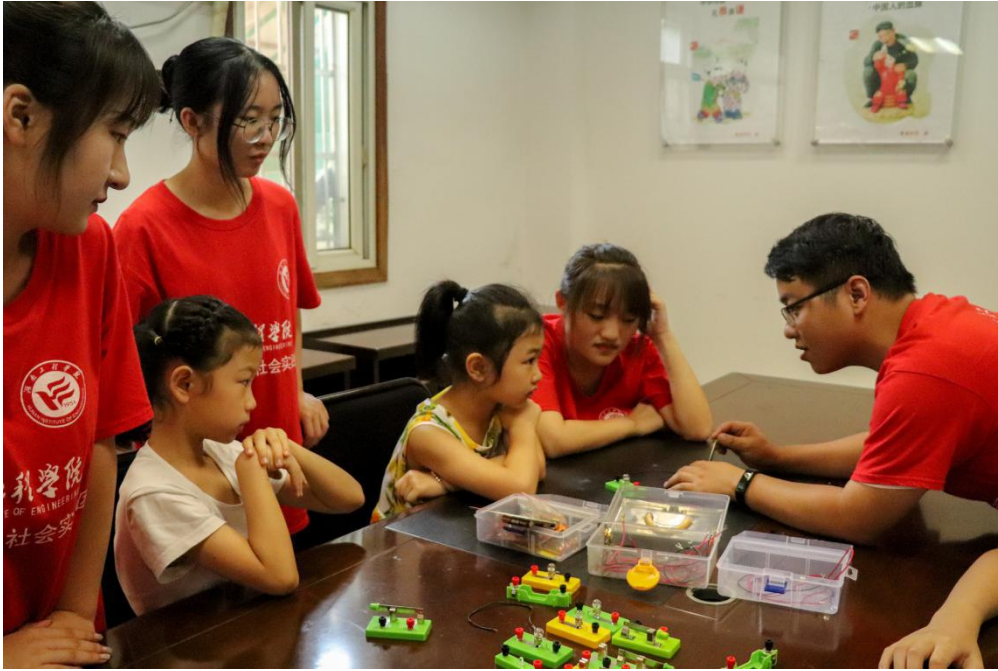
小朋友学习物理小实验

在这为期四天的“三下乡”实践活动中，该实践队深入群众之间，聆听群众心声，宣传红色历史。用心中如火的热情，发扬红色精神，展大学生风貌，扬大学生风采。不忘初心跟党走，共唱红色献青春。