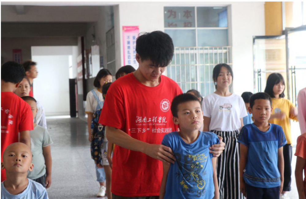
志愿者调整孩子们的立正姿势

为了提高孩子们的安全意识，在一定程度上保护自己，志愿者给孩子们上了一节擒拿格斗课。志愿者亲身示范军体拳，细心讲解擒拿格斗的基本技巧，并邀请孩子们上台进行搭档，“你们看，这个动作如果这样……”。孩子们抬头挺胸，站的一个比一个笔直。通过实践