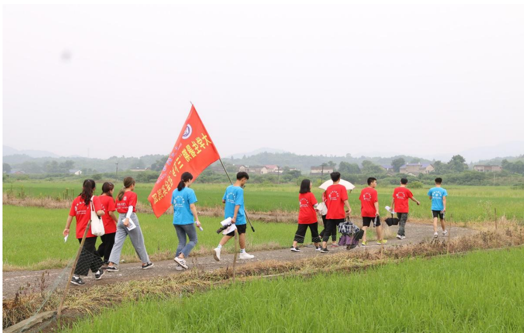
志愿者深入当地开展实践调研

今年是祖国七十周年华诞，为助力乡村经济振兴，培养大学生服务乡村的意识，调研组以调研访谈的形式前往上湖村、湖山村探索新农村现状与发展模式。志愿者围绕爱国主义、十九大精神、精准扶贫政策将宣传资料挨家挨户进行宣讲、调研。志愿者通过与村支书的交流，了解到泉塘镇“扶贫帮困”的现状 & 现代农业示范园的基本情况，村干部们十年如一日带领泉塘镇各村利用资源发展现代农业示范园建设、美丽乡村示范镇区项目建设，成为新农村建设标杆。在调研过程中志愿者从村干部及村民身上看见了新时代农民奋斗的身影，他们不忘初心，牢记使命，这份执着、创新、坚守的精神值得大学生学习。调研组还寻访了三位与祖国同龄的老党员，听他们讲述老党员的初心和奋斗，志愿者从中感受到了他们与祖国共成长幸福人生，坚定了为建设祖国而奋斗的信念。