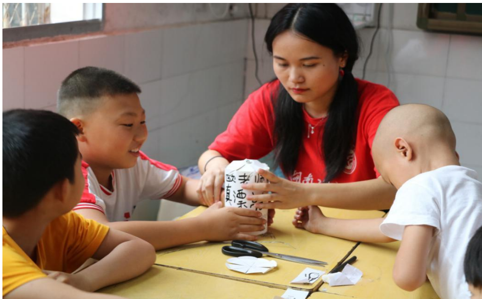
孩子们与志愿者一起制作走马灯

走马灯是传统节日玩具之一，属于灯笼的一种，在酸雨小实验之后，志愿者带小朋友们进行了走马灯的制作。同组的小朋友分工合作，在纸上画出了自己喜欢的各种图案，每一步，认真而谨慎。最后，共同制造出了成品。“老师，走马灯为什么会转呢？”，在得到回答后，小朋友们茅塞顿开。“老师，你们可真厉害！”略带童真的语气中，满满的都是崇拜与喜爱。