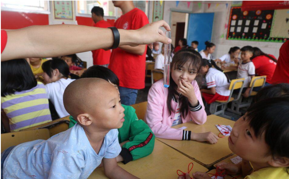
孩子们认真观看实验现象

走马灯是传统节日玩具之一，属于灯笼的一种，在酸雨小实验之后，志愿者带小朋友们进行了走马灯的制作。同组的小朋友分工合作，在纸上画出了自己喜欢的各种图案，每一步，认真而谨慎。最后，共同制造出了成品。“老师，走马灯为什么会转呢？”，在得到回答后，小朋友们茅塞顿开。“老师，你们可真厉害！”略带童真的语气中，满满的都是崇拜与喜爱。