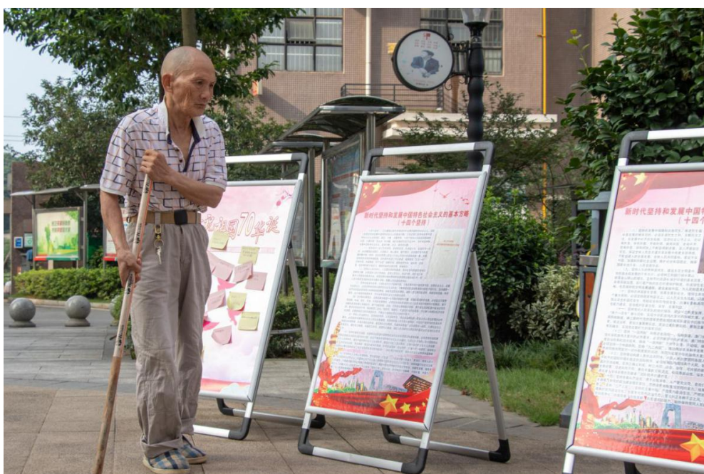
居民阅读红色长廊

洋溢、满面笑容的舞蹈表演《吉祥》、同学们激情饱满的大合唱《在灿烂阳光下》足以体现革命的成功。随着社会主义事业一步步地建设，如今人们的生活水平已经有了质的飞跃，人民的温饱问题已经全部解决，在过好日子的同时可以发展自己的业余爱好。我们今天在灿烂阳光下成长是当年无数的爱国者用生命换来的，我们应当勿忘祖国的艰难历史，牢记使命为新时代的中国特设社会主义事业建设付出自己的力量。