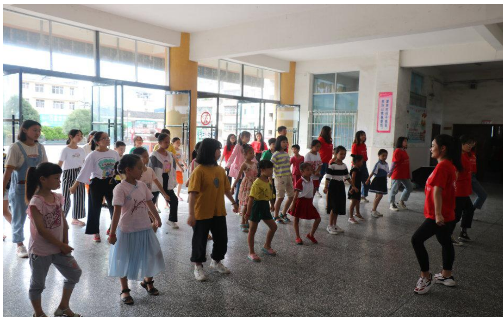
孩子们在志愿者的带领下大方地展示自己

内向的孩子，总希望自己能自信演讲，却又迟迟不敢上台。在舞蹈课上，志愿者们通过教海草舞，亲身示范每一个动作，鼓励每一个胆小的孩子自信、勇敢地展示自己。