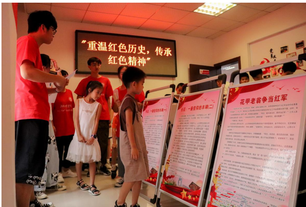
在实践团的带领下阅读红色长廊

“重温红色历史，传承红色精神”盘龙社区红色教育宣传活动圆满结束，活动从整体上让更多的小朋友了解红色文化、红色精神，将红色的种子种进小朋友的心里。