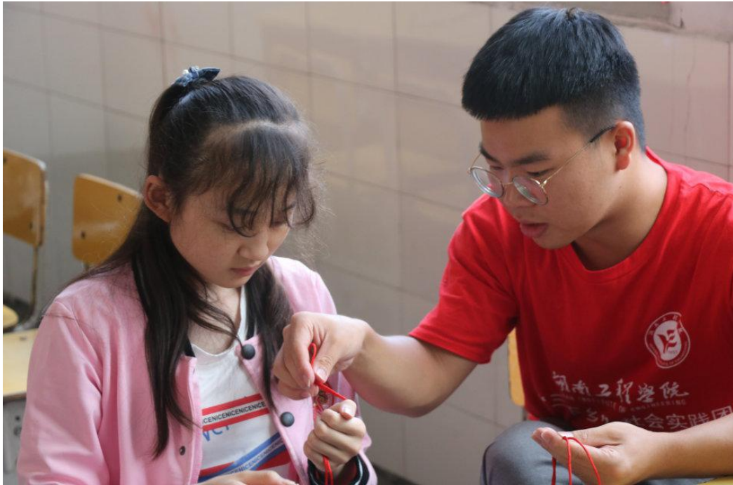
志愿者教孩子编织中国结