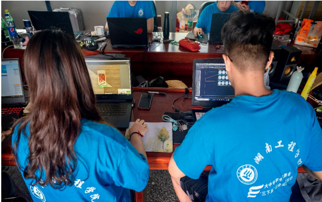
志愿者正在为农产品设计包装

绿水青山就是金山银山，我校设计艺术学院设计专业学生深入践行习近平总书记的这句话，他们组成的“送设计下乡”团队以“艺术介入乡建”的方式，通过实地走访调查泉塘镇蔬菜产业基地，对各类农产品进行详细分析，讨论方案，为当地农产品进行包装设计。志愿者结合专业知识，抓住农产品包装的核心价值，环保、保鲜、直观的其设计了一系列的外包装。结合当下热销农产品如：辣椒、甜瓜、水果南瓜等，在设计思维的表达上大胆创新，采用管式折叠飞机盒、盘式折叠飞机盒、管盘式折叠飞机盒等不同形式和不同材质的外包装，遵循“人与自然”“看得见”的理念，为农产品赋能。据了解，农产品包装设计工作已经形成了 10 多份设计初稿，在三下乡实践活动结束后进入后期设计，通过指导老师及当地农产品负责人的指导及建议，进行最终的设计定稿，为当地农业发展做出理念贡献。