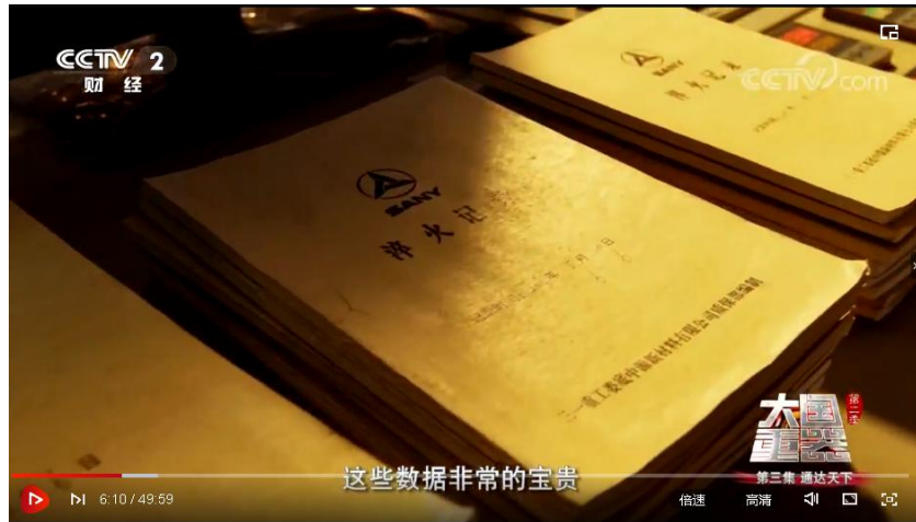
易小刚团队研制过程的淬火记录