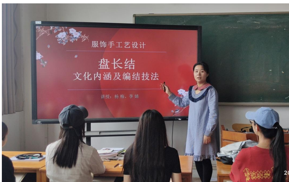
图 1 盘长结课堂

样例旨在引导学生了解我国优秀手工文化遗产中国结（盘长结）的文化内涵与编织工艺，以 2022 北京冬奥会上的中国结（盘长结）艺术导出盘长结的起源、盘长结蕴含的象征意义，盘长结的编织技法。让学生掌握编结知识与技法的同时感受到文化自信、审美情趣和工匠精神的价值传递。增强学生的人文情怀与责任担当。