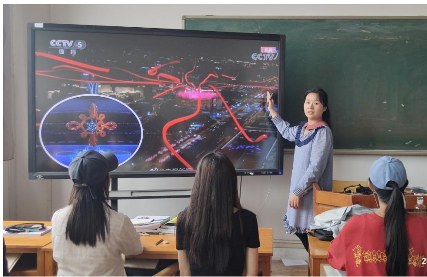
图 2 教师通过时政热点视频导入知识点