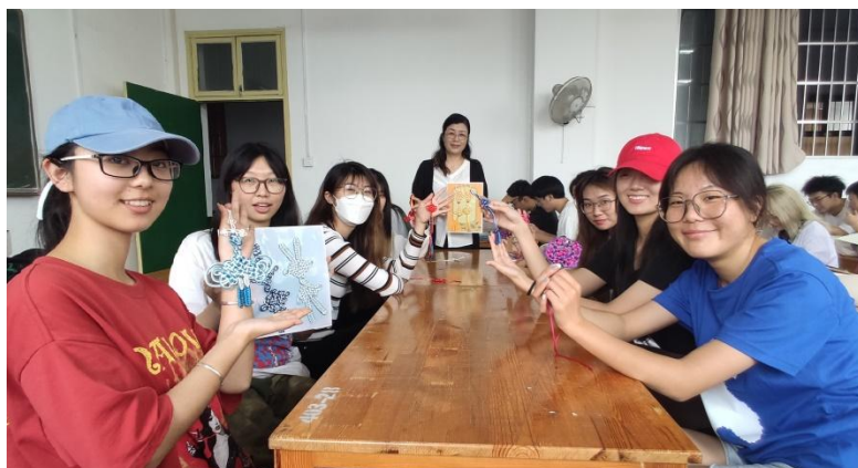
图9 学生展示盘长结设计作品