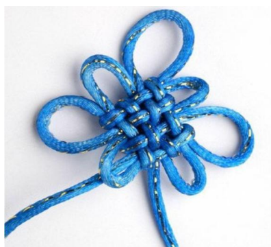
图 6 盘长结成品实物图