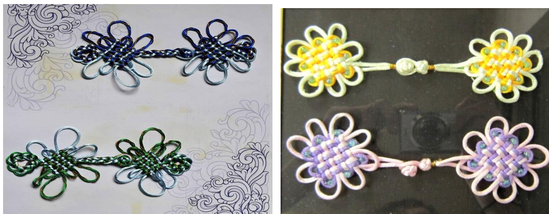
图10 学生盘长结综合设计作品案例

课后创作：爱国教育——在国庆节到来之际，请同学们结合课堂上前期所学习的编结技法进行小组创作，为祖国献上一份贺礼，表达对祖国的热爱。培养学生的团队协作能力和创新精神。