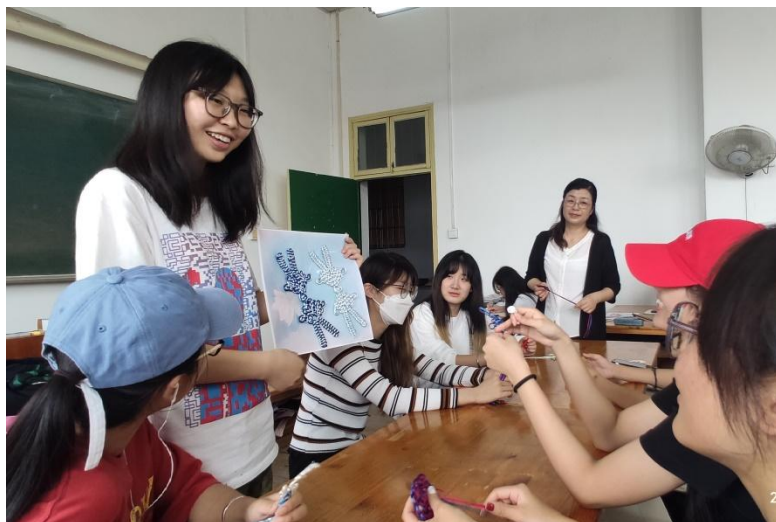
图8 学生讲解盘长结作品设计过程